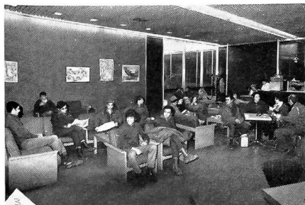
Ein Erholungsheim für Soldaten und, wie das Bild zeigt, auch für die Chen-Mädchen; die Israelin ist bekanntlich auch dienstpflichtig.

In den strapaziösen Feldzügen in Algerien suchten sich die französischen Soldaten, die Bekleidung auf jede denkbare Weise zu erleichtern. Aus dem Tschako rissen sie alle Versteifungen heraus, so dass die übriggebliebene Stoffhülle zusammenfiel und der Deckel nach vorn auf den Augenschirm sank. Diese eingeknickte und zusammengesunkene Kopfbedeckung gewährte den Eindruck des aus schweren Feldzügen heimgekehrten erfahrenen Kriegers. Mochten auch die altmodischen Österreicher und Schweden weiter den Deckel ihrer Kopfbedeckung waagrecht tragen, im amerikanischen Bürgerkrieg (1861—1863) trugen beide Parteien, die konföderierten Südstaaten und die Union, ihre Mützen nach vorn eingeknickt. Mexi-