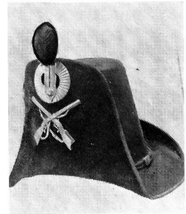
Scharfschützenhut, 1853—1844. Gelbe Metallgarnituren. Kokarde: innen schwarz, aussen weiss. Pompon grün. Ehemalige Sammlung H. Peret.