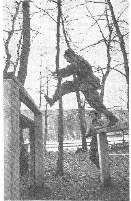
Auf der Kampfbahn im Brugger Schachen konnte die Kondition so richtig «angekurbelt» werden.

Die Brugger Genie-Unteroffiziersanwärter waren in den vorangegangenen vier Wochen Ausbildungszeit sorgfältig und umfassend auf ihre künftige Aufgabe hin als militärische Vorgesetzte ausgebildet und trainiert worden, so dass es nicht verwunderlich war, dass alle mit einer guten Moral an den Start der Schlussübung «Finale» gingen, die vom Instruktionspersonal des Waffenplatzes