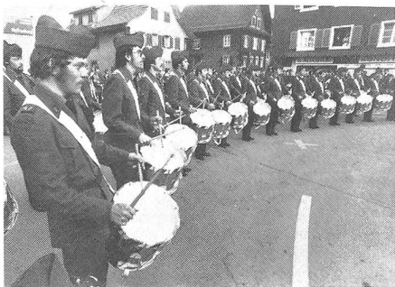
Soll es solche Bilder inskünftig nicht mehr geben? Tambouren Spiel Geb Div 9