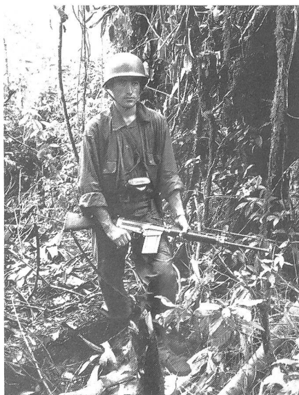
Die Suche nach dem Feind — eine unheimliche, eine gefährliche und eine aussichtslose Aufgabe für einen einzelnen Soldaten.