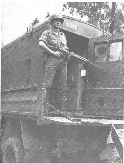
Auch gepanzerte Armeefahrzeuge müssen gegen Terroranschläge der ERP-Guerilleros bewacht und geschützt werden.