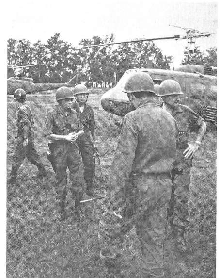
Die modern ausgerüsteten Truppen der Brigade Bussi werden mit Helikoptern ins Kampfgebiet geflogen.