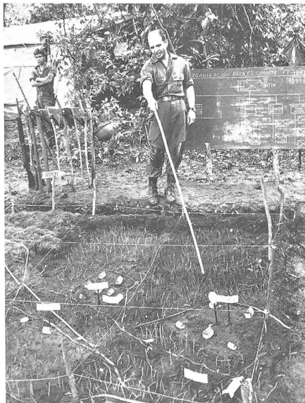
Am Geländemodell werden Offiziere und Unteroffiziere mit der bevorstehenden Operation vertraut gemacht und in ihre Aufgaben eingewiesen.