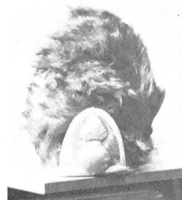
Grenadiermütze des Regiments Estavayer, 1785. Dunkelbraunes Bärenfell, rotes Schild, gelbe Granate und Umrandung. Sammlung L. Rousselot, Paris.