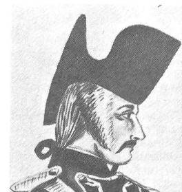
«Ein Gemeiner vom 3ten Zuzug in der Uniform der ehemaligen Schweizer Garde» aus Paris. Nachzeichnung von A. Pochon nach einem Aquarell von M. Heusler. Schweizer Landesbibliothek Bern.