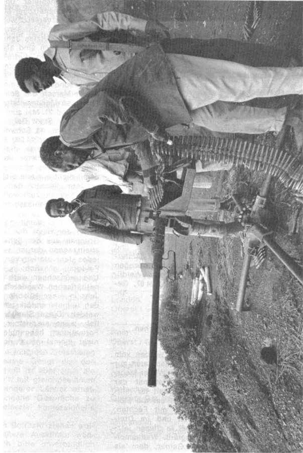
zwischen Äthiopiern und Somalis.