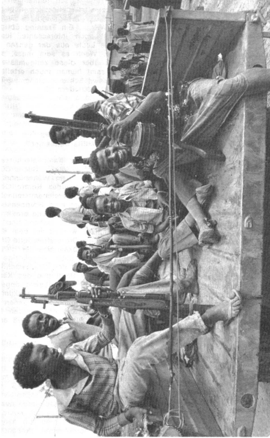
Mit erbeuteten sowjetischen Waffen ausgerüstete Soldaten der Befreiungsfront auf dem Weg ins Kampfgebiet.