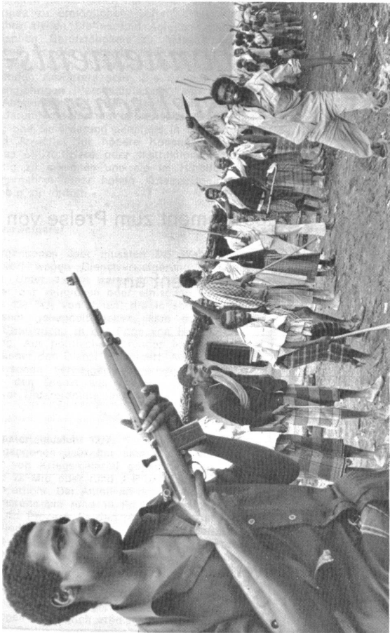
Soldaten der Befreiungsfront bei der Ausbildung.