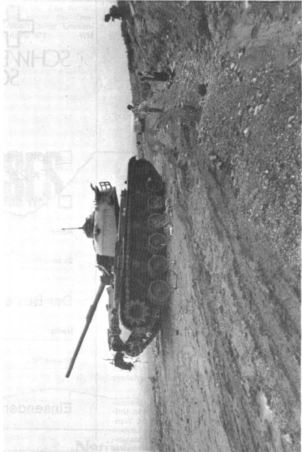
Erbeutetes sowjetisches Kriegsmaterial aus den jüngsten Kämpfen . . . . .