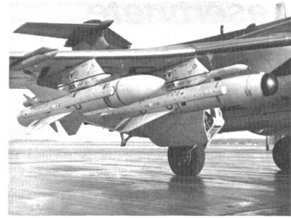
AJ.168 Martel an der inneren Flügelstation eines Tiefangriffsflugzeugs des Typs Buccaneer. Links im Bilde sehen wir einen für die Bekämpfung von Radarstationen ausgelegten Martel-Flugkörper der Ausführung AS37. (ADLG 12/77) ka