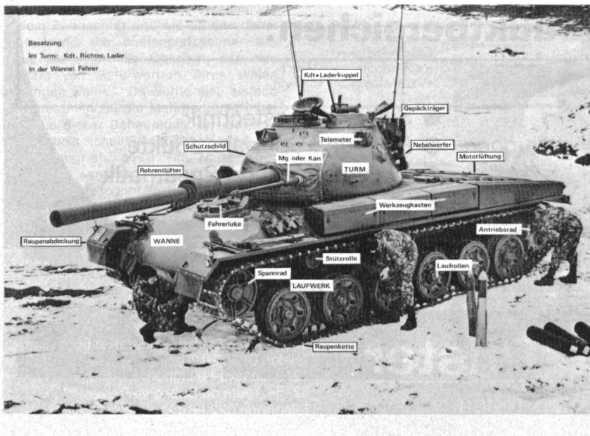
TEILE DES KAMPFPANZERS (PZ 61)