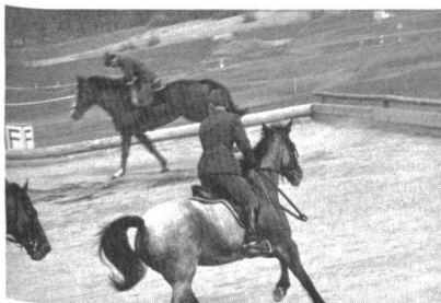
Auf der Reitbahn wurden verschiedene Vorfürhrungen geboten: