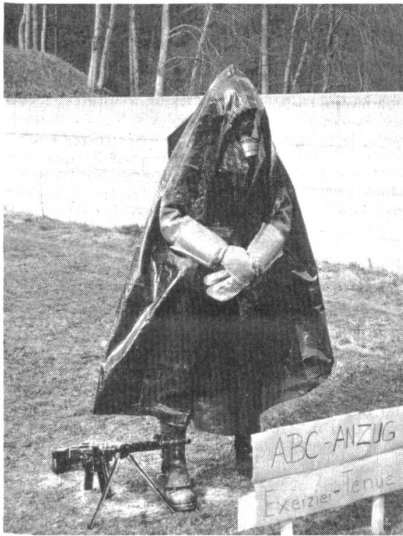
Mann im ABC-Anzug. Die Ausrüstung des Schweizer Soldaten gegen chemische und atomare Kampfstoffe ist heute auf dem neuesten Stand.

Oberst i Gst Amstutz erklärte, dass der Train-Soldat nicht nur mit dem Pferd umzugehen wisse, er müsse sich, sein Pferde und seine Einrichtungen auch verteidigen können. Dazu stehen ihm diverse Waffen zur Verfügung. Der Tr Sdt beherrscht den Kampf mit dem Sturmgewehr und seinen Panzerabwehrmöglichkeiten. Zudem ist er ausgebildet am Raketenrohr, welches er zur Bekämpfung von Panzern aus weiterer Entfernung einzusetzen versteht. Im weiteren ist er im Umgang mit HG bestens geschult. Neuerdings erhält der Tr Sdt ebenfalls Ausbildung im Nahkampf. Nach dem Genuss eines ausgezeichneten Pot-au-feu konnten die Besucher in aller Ruhe die modern eingerichteten Stallungen besichtigen, wobei besonders die Angehörigen der Rekruten Gelegenheit hatten, den vierbeinigen Kameraden ihres Zöglings zu begutachten. — Der Besuchstag der Tr RS 18/78 war eine Demonstration des Wehrwillens im besten Sinne des Wortes. E. E. B.