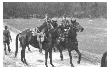
Die Übergabe der Reitpferde an die berittenen Ordonnanzen bestätigt eine gute Zusammenarbeit zwischen Offizier und Ordonnanz.