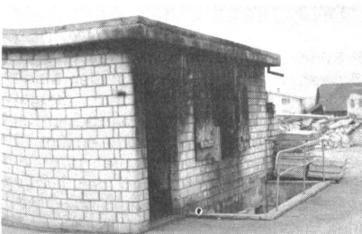
Übungsgebäude für Brandschutz und Brandwehr