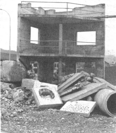
Übungsruine für die Bergung von Verletzten