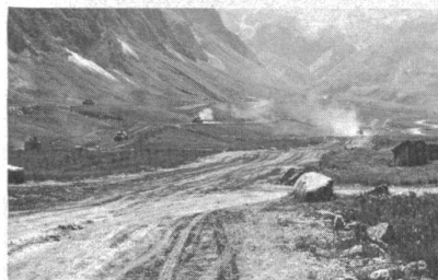
Und so sieht der Platz für den Panzermann aus

In der ersten Junihälfte konnte im Serntal im Glarnerland der Schiessplatz Wichlen offiziell übernommen werden. Wichlen ist für den Ausbildungsstand der Armee von hoher Bedeutung. Es ist einer der fünf grössten Übungsplätze der Schweiz; für die mechanisierten Truppen ist es einer der drei grössten Plätze. Die Übernahme ist aus zwei Gründen bemerkenswert. Erstens konnte eine fast 20 Jahre währende Vor- und Leidensgeschichte abgeschlossen werden — so erfolgreich übrigens, dass die direkt Betroffenen mit dem ausgehandelten Ergebnis mehr als zufrieden sind. Zweitens ist es im Glarnerland gelungen dank enger Zusammenarbeit der zivilen und militärischen Stellen nicht nur einen Panzer-schiessplatz zu bauen, sondern auch die Infrastruktur eines ganzen Tales entscheidend zu verbessern. Die Schaffung des Schiessplatzes hat nicht nur der Gemeinde neue Mittel zugeführt und den Ausbau von Strassen und Wanderwegen gefördert, sondern auch die Melioration grosser Alpgebiete ermöglicht.