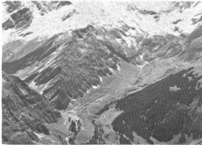
Das Schiessplatzgelände aus der Vogelperspektive

Militärische, touristische und alpwirtschaftliche Bedürfnisse unter einem Hut