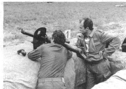
Deutsche Patrouille auf dem Gefechtsparcours

Thurgauischer Kantonaler Dreikampf vom 26. August 1978