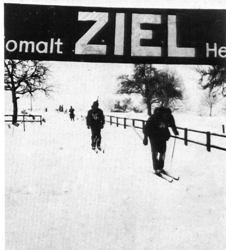
Einlauf ins Ziel!