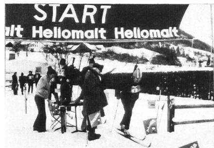
Und ab geht die Post

Für einmal hatten die Organisatoren des Unteroffiziersvereins Zürcher Oberland nicht um den Schnee zu bangen. Im Gegenteil, die zahlreichen Schneefälle am Vortag des Wettkampfes zwangen sie zu zusätzlichen Spuarbeiten. Dies zahlte sich dann auch aus, konnte man doch von den Wettkämpfern nur Lobenswertes über die ausgezeichnete Organisation hören. Eine Temperatur um 0 Grad herum stellte die Teilnehmer jedoch vor