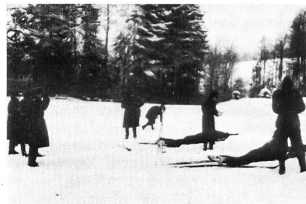
Manche trafen, manche nicht! Oder: nicht jeder Schuss war auch ein Treffer!