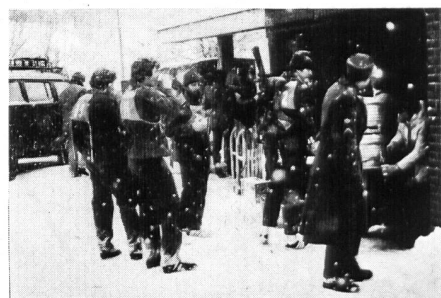
Nach geschlagener «Schlacht»