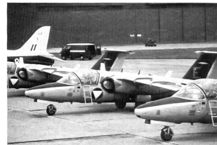
Die österreichische Luftwaffe entsandte 4 Saab-105-Maschinen, die unter der Bezeichnung «Karo As» ein vielbeachtetes Kunstflugprogramm zeigten. Wann kann unsere «Patrouille Suisse» an solchen Anlässen ihr Können demonstrieren?