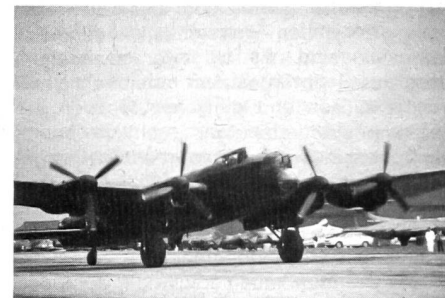
Ein besonderer Verband der Royal Air Force, der sogenannte «Battle of Britain Memorial Flight», hegt und pflegt eine Anzahl berühmter Maschinen aus dem Zweiten Weltkrieg (Spitfires, Hurricanes, Lancasters, Sea Furies, Swordfish usw.), die alle in flugtüchtigem Zustand gehalten werden. Hier rollt ein viermotoriger Lancaster-Bomber zum Start.