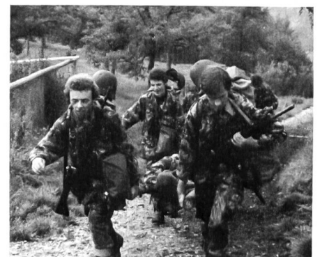
Marsch und Kameradenhilfe

(Aus «Lexikon der Psychologie», Band 2; Herder, 1971)