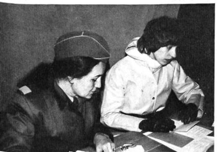
Zwei von vielen, treuen Helferinnen am Schaffhauser Nachtpatrouillenlauf 1979.