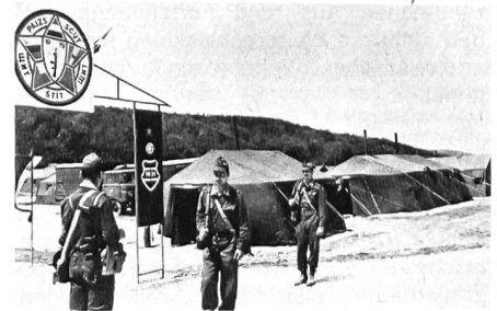
Wachtposten vor dem in fünf Sprachen gehaltenen Manöversignet «Schild 79».