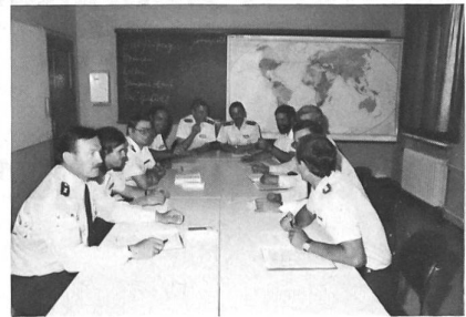
Junge Offiziere beim in lockerer Form durchgeführten Unterricht

Bataillonskommandeure und vergleichbare Dienstposteninhaber eine Orientierung über die zentralen Probleme der Inneren Führung, besonders über Menschenführung und Politische Bildung. Im «Grundlehrgang für Jugendoffiziere» erhält dieses wichtige Verbindungsglied zwischen Streitkräften und Schule das notwendige Rüstzeug vermittelt, um sachgerecht und glaubwürdig zu informieren und die erforderliche Sicherheit im Gespräch und in der Diskussion mittels didaktisch/methodischer Hilfen zu gewinnen. Die «Wehrpolitischen Informations-tagungen» informieren Teilnehmer aus allen Gruppen der Gesellschaft durch Referate und Diskussionen über grundsätzliche Fragen der Bundeswehr, deren Auftrag, Stellung in Staat und Gesellschaft und politische Rolle als Vollzieher staatlicher Gewalt. «Bilaterale Seminare mit Offizieren und Unteroffizieren verbündeter Streitkräfte» ermöglichen die Begegnung und den Dialog zwischen Soldaten der Bundeswehr und der verbündeten Streitkräfte. Auch hier tauscht man Meinungen und Erfahrungen über