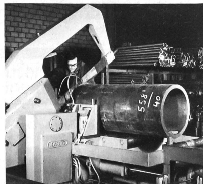
Eine unserer 15 Spezialsägen

Wir haben normalwandige nahtlose Siederohre, Präzisions-Zylinderrohre, verchromte Kolbenstangen, nahtlose und geschweisste Form-Stahlrohre.