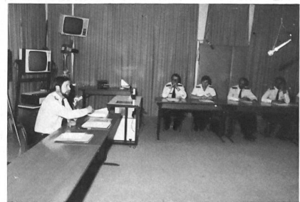
Der Einsatz moderner Unterrichtshilfen hebt das Niveau des Unterrichtes