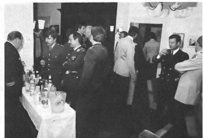
Der zwanglose Kontakt mit Angehörigen verbündeter Streitkräfte an der «Saftbar» dient dem gegenseitigen Kennenlernen