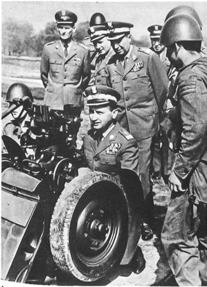
Armeegeneral Wojciech Jaruzelski, seit 1968 Minister für Nationale Verteidigung, besucht ein Artillerie-Regiment.