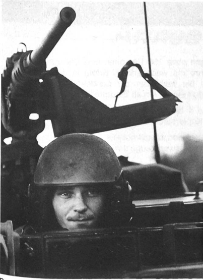
Panzerbesetzungen sind besonders stark belastet

schaft ein weiteres verzerrtes Beispiel übertriebenen Leistungsdenkens, welches in seinen Auswirkungen den eigentlichen Forderungen überhaupt nicht entspricht.