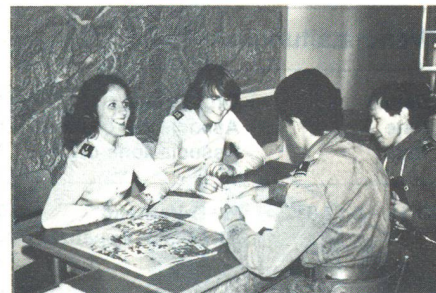
Gerne helfen zwei charmante FHD den Wettkämpfern, in kurzer Zeit möglichst viele Informationen über den FHD zu sammeln.

schleuder auf Büchsen. Wir wurden für diese ganze Spezialaufgabe mit 79 von 100 möglichen Punkten belohnt. Das war die höchste erreichte Punktezahl in dieser Disziplin, was uns sehr freute. Dann flog uns der Heli zurück nach Dübendorf. Kurz vor Mittag folgte die letzte Aufgabe. Beide mussten je einen Teil der Kampfbahn überqueren und dabei eine Aufgabe lösen: ein Maschinengewehr zusammensetzen (mein Partner) und ACSD (ich). Der «Bärentritt» ist heute noch ein Alptraum für mich! Dazwischen mussten wir zudem Fragen aus der Kartenlehre beantworten. Damit war unser Wettkampf beendet. Nach einem kurzen Schlussrapport traf man sich mit Angehörigen oder Freunden zum wirklich sehenswerten Rahmenprogramm. Abends am Fliegerfest warteten alle gespannt auf die Ranglisten. Wir wussten zwar, dass wir keine Chancen hatten zu gewinnen, aber uns ging es darum, die persönlich gesteckten Ziele zu erreichen. Unsere Freude, das geschafft zu haben, war sicher ebenso gross wie die der Sieger. Jedes Jahr stecken wir unsere Ziele einfach noch etwas höher. Es wäre schön, wenn noch mehr Sie und EPatrouillen mitmachen würden, dann gäbe es wirkliche Leistungsvergleiche. Also Kameradinnen, rafft Euch auf, meldet Euer Interesse bei Euren Kommandanten an, und dann treffen wir uns im nächsten Jahr an der AMEF 1982! DC Marianne Beck-Froelicher