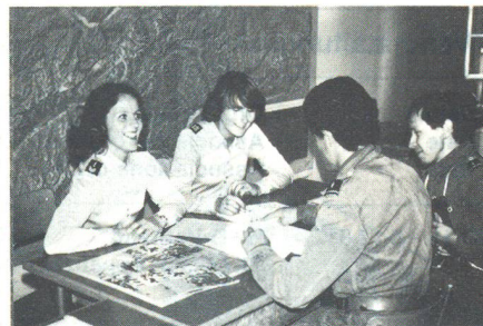
Gerne helfen zwei charmante FHD den Wettkämpfern, in kurzer Zeit möglichst viele Informationen über den FHD zu sammeln.

schleuder auf Büchsen. Wir wurden für diese ganze Spezialaufgabe mit 79 von 100 möglichen Punkten belohnt. Das war die höchste erreichte Punktezahl in dieser Disziplin, was uns sehr freute. Dann flog uns der Heli zurück nach Dübendorf. Kurz vor Mittag folgte die letzte Aufgabe. Beide mussten je einen Teil der Kampfbahn überqueren und dabei eine Aufgabe lösen: ein Maschinengewehr zusammensetzen (mein Partner) und ACSD (ich). Der «Bärentritt» ist heute noch ein Alptraum für mich! Dazwischen mussten wir zudem Fragen aus der Kartenlehre beantworten. Damit war unser Wettkampf beendet. Nach einem kurzen Schlussrapport traf man sich mit Angehörigen oder Freunden zum wirklich sehenswerten Rahmenprogramm. Abends am Fliegerfest warteten alle gespannt auf die Ranglisten. Wir wussten zwar, dass wir keine Chancen hatten zu gewinnen, aber uns ging es darum, die persönlich gesteckten Ziele zu erreichen. Unsere Freude, das geschafft zu haben, war sicher ebenso gross wie die der Sieger. Jedes Jahr stecken wir unsere Ziele einfach noch etwas höher. Es wäre schön, wenn noch mehr Sie und EPatrouillen mitmachen würden, dann gäbe es wirkliche Leistungsvergleiche. Also Kameradinnen, rafft Euch auf, meldet Euer Interesse bei Euren Kommandanten an, und dann treffen wir uns im nächsten Jahr an der AMEF 1982! DC Marianne Beck-Froelicher