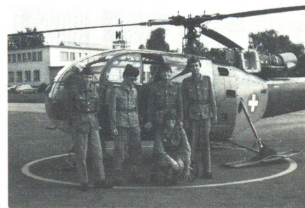
In ein paar Minuten wird die Alouette sanft abheben, uns durch die Lüfte tragen und an einem unbekanntem Ort absetzen...