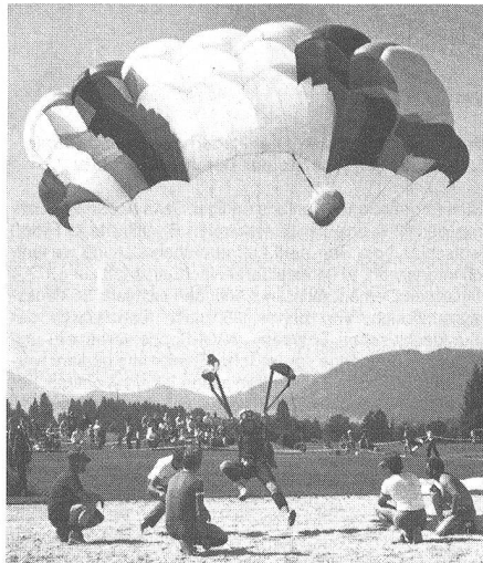
Kpl Gass Roland beim Landeanflug und treten eines «Nullers»

Dem Leitungsteam zeigten diese Erfolge aber, dass wir mit der neuen Videoanlage, den Trainingslagern und den Trainingsmethoden doch auf dem richtigen Weg sind. Denn sehr gute Wettkämpfer hatten wir immer in der Fsch Gren Kp 17. Gedankt sei an dieser Stelle auch jenen Kommandostellen beim Stab GA und dem BAFF, die uns diese ausserdienstlichen Wettkämpfe im In- und Ausland immer wieder ermöglichen.