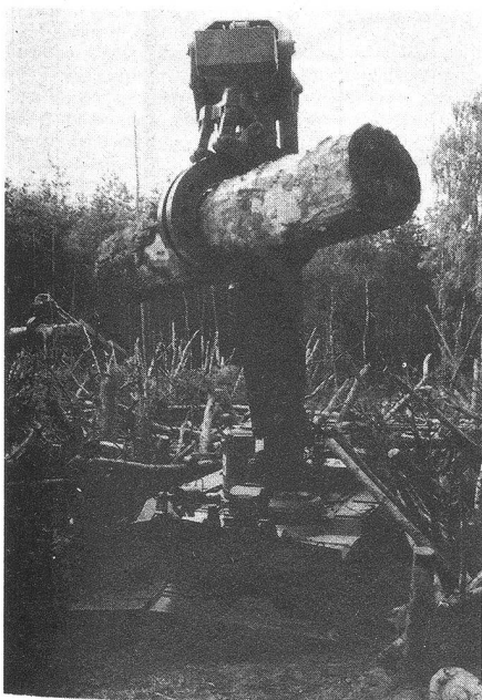
Spezialpanzer auf der Basis des Panzers T-55 mit Ausleger zum Räumen von Hindernissen. A T