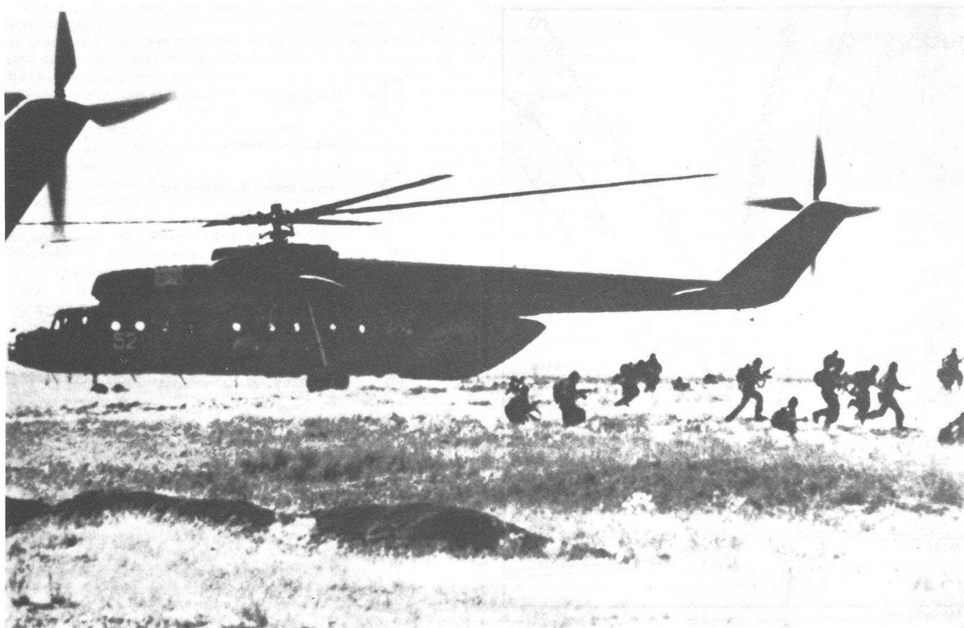
65 voll ausgerüstete Soldaten stürmen aus einem Grosshubschrauber Mi-6 (HOOK). Nach dem Angriff geht die luftgelandete Truppe zur Verteidigung und zum Halten über, bis der Zusammenschluss mit den vorstossenden Verbänden erfolgt.

Hptm Rybakov lässt die Kompanien absichtlich nicht direkt in jenen Räumen landen, in welchen sie sich anschliessend zur Verteidigung einzurichten haben. Die Landeplätze werden in unmittelbarer Nähe des Flussübergangs gewählt, einerseits weil sich die Hauptkräfte des Feindes auf dem Nordufer des Flusses befanden; Obschon durch das Vorbereitungsfeuer dezimiert und durch die Jagdbomber niedergehalten, könnten sie trotzdem noch mit ihrem Feuer die Überwindung des Flusshindernisses erschweren. Um den Auftrag erfüllen zu können, muss vorgängig das Nordufer gesäubert werden. Andererseits bestünde die Gefahr, dass die (direkt am Standort) ihrer Verteidigungsstellungen gelandeten Kp vom Flussübergang abgeschnitten werden könnten.