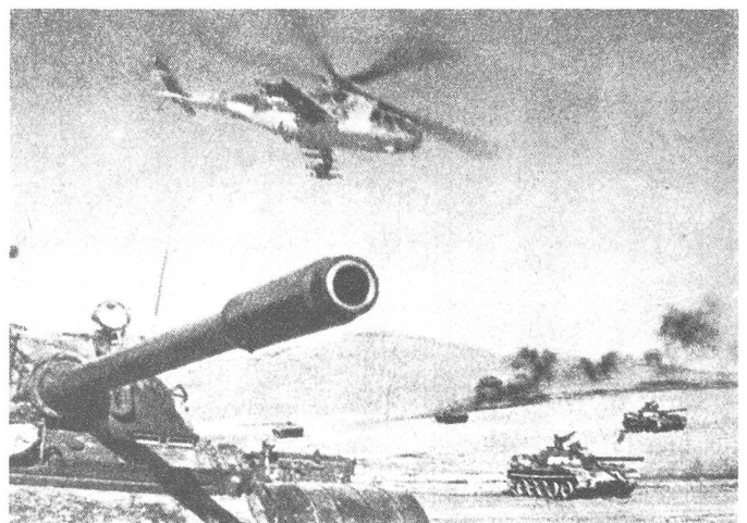
Ein MotSchützen-Bataillon hat im gegnerischen Hinterland ein Schlüsselgelände überraschend in seine Hand genommen und hält dieses, bis Truppenteile von der Front zu ihm stossen – auf dem Bild unterstützt durch Kampfhelikopter.

(In allen Einzelheiten schildert M Tytschkov den Ablauf der einzelnen Gefechtsaktionen. In der Folge sollen nur noch jene Punkte kurz Erwähnung finden, welche im Zusammenhang mit einer taktischen Luftlandung von Bedeutung sind.)