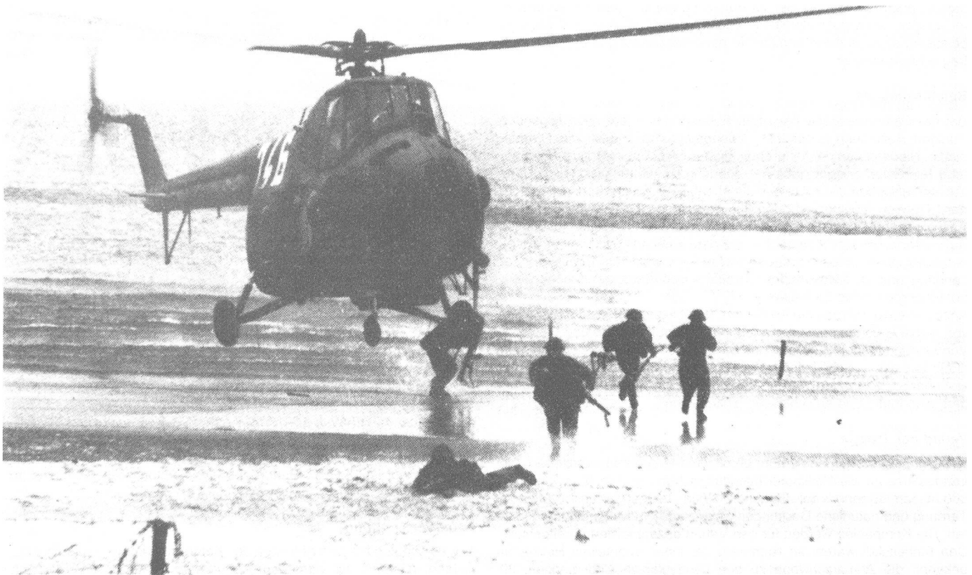
In der ersten Staffel landen Gefechtsaufklärungstrupps – im Bild aus einem Mi-4 (HOUND)

auf den rund 3,5 km östlich vom Flussübergang gelegenen Stützpunkt, ein Kernwaffenschlag mittleren Kalibers geführt. Dafür spricht auch die Tatsache, dass nach der taktischen Luftlandung dieser Stützpunkt ausser acht gelassen wird; Da der Gegner nach sowjetischer Auffassung «mit einem Kernwaffenschlag in einem bestimmten Radius vollständig vernichtet werden kann, sind in diesem Raum Feuer und Stoss überflüssig». Voennyj Vestnik, 6, 1965.) Im Augenblick der Helikopterlandung werden Truppen und Waffenstellungen im Raum der Brücke mit dem Feuer der taktischen Luftwaffe niedergehalten und gleichzeitig das Vorstossen des Gegners aus benachbarten Verteidigungsstellungen unterbunden.