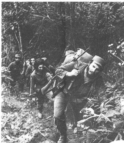
Fidel Castro – als er noch Partisanenführer in den Bergen von Kuba war.

Die modernen Streitkräfte Kubas entstanden nach ihrer ersten ernsten Bewährungsprobe am 17. April 1961. Damals versuchte eine 1350 Mann starke Invasionstruppe, bestehend aus kubanischen Emigranten und Castrogegnern, an der Playa Giron (Schweinebucht) Fuss zu fassen und in einem revolutionären Gegenangriff Kuba wieder für die westliche Demokratie zu gewinnen. Sie liefen in eine Falle und da die militärische Unterstützung der USA ausblieb, wurde die «Invasionstruppe» binnen 72 Stunden von der Übermacht besiegt und zer schlagen.