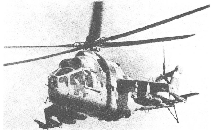
Nach der Landung genießt die gelandete Truppe präzise Luftnahunterstützung von Kampfhelikoptern und Erdkampfflugzeugen. Auf dem Bild ein Mi-24 (HIND) Kampfhelikopter mit 4 Raketenpods à 32 Raketen und 4 PAL.

Das Bat hat den Aufnahmebereich bereits im Morgengrauen bezogen. Die Landeplätze für die Helikopter befinden sich in einer Distanz von 500–600 m vom Standort der Einheiten. Wald, hohes Gebüsch verleihen Tarnung und natürliche Deckungen Schutz vor feindlichen Fliegerangriffen. Die Kompanien werden für den Verlad dezentralisiert bereitgestellt. Den Einheitskdt waren die Nummern der ihnen zugeteilten Helikopter bekannt, die Anmarschwege zu den Landeplätzen sind markiert. 30 Minuten vor dem Start waren die Einheiten bereit zum Verlad. Hptm Rybakov gab den Befehl, sich zu den Landeplätzen vorzuschieben. Als die Helikopter eintreffen, legt der Bat Kdt mit dem Kdt des Helikopterverbandes definitiv Verlad von Truppen und Material sowie die Landeplätze und Ausweichlandeplätze fest. Von diesem Moment an sind die Truppen dem Kdt des Helikopterverbandes unterstellt und haben seine