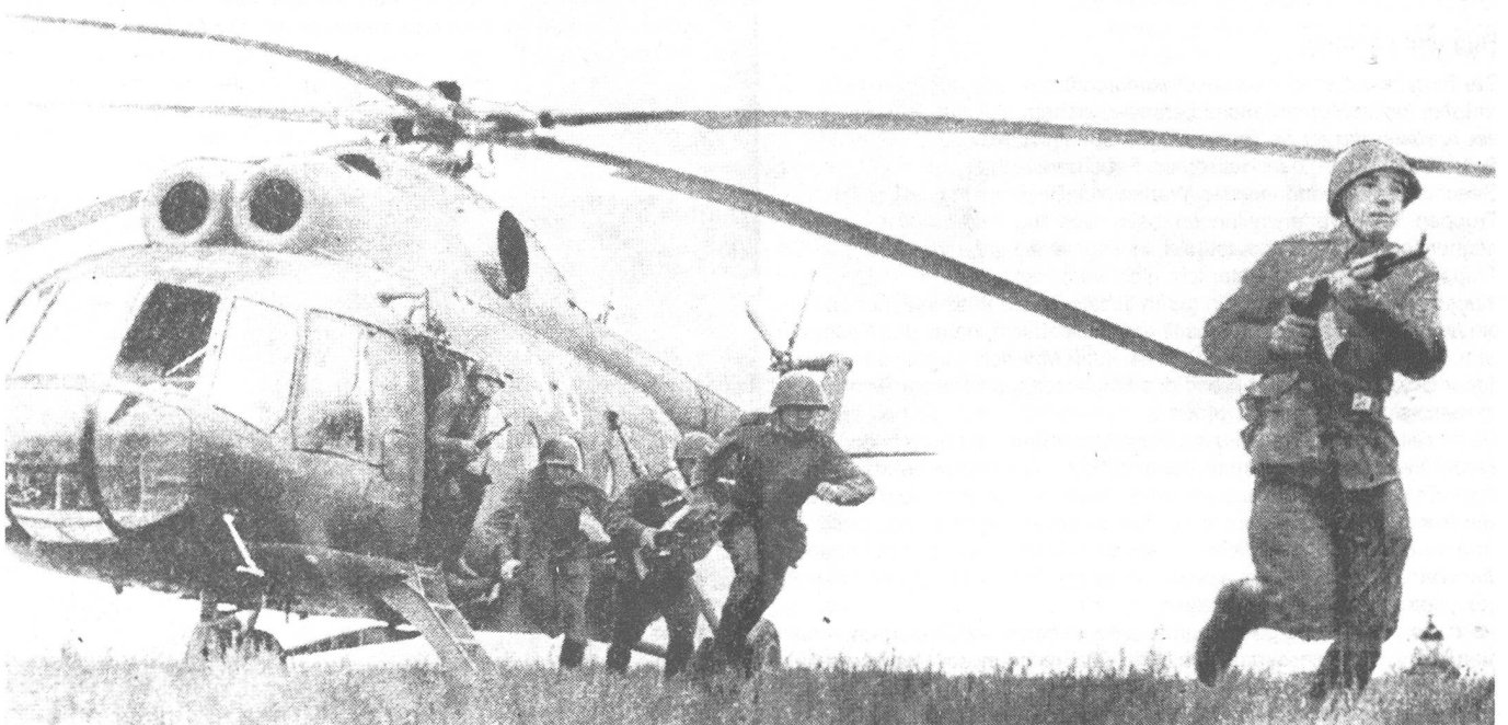
Die Landezone befindet sich so nahe am Angriffsziel wie möglich. In der näheren Umgebung der Landezone sollen natürliche Deckungen für die Truppe vorhanden sein. Der Auslad der Truppe bedarf nur weniger Minuten – im Bild verlassen 28 ausgerüstete Soldaten einen Mi-8 (HIP).

Vor 20 Minuten bis zum Absetzen des Bataillons wird der «Hauptschlag» geführt. (Gemeint ist, dass dem Angriff eine starke Feuervorbereitung durch Artillerie, Raketenwerfer und durch den Einsatz der taktischen Luftstreitkräfte voranging. Das verwendete russische Wort kann auch «Nuklearschlag» bedeuten. Taktische Kernwaffen, als schwerstes Feuerunterstützungsmittel des Divisionskommandanten, werden vor Beendigung der Feuervorbereitung gegen erkannte feindliche Schwerpunkte eingesetzt. Entsprechend der Lageskizze in «Voennyj Vestnik» wurde