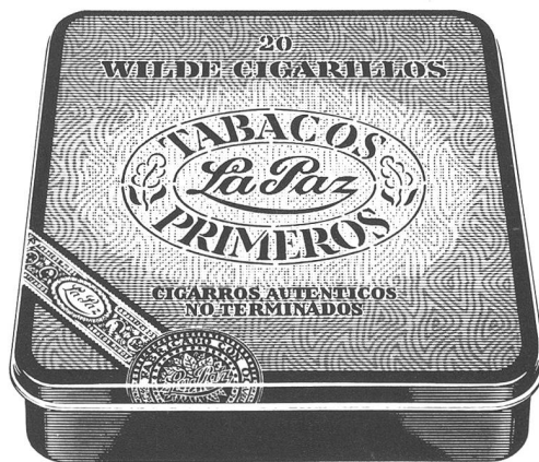
Wilde Cigarillos Havana- und Brazil-Type von La Paz Die ehrlichen Wilden Cigarillos aus reinem, unverfälschtem Tabak. 20 Stück Fr. 8.—

Wenn Sie noch mehr über La Paz erfahren möchten, verlangen Sie bitte mit einer Postkarte die interessante Broschüre «Die Cigarre» direkt beim Importeur Säuberli AG Basel, Postfach, 4002 Basel.