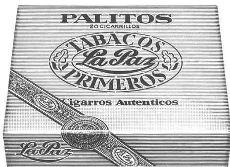
Cigarillos Palitos von La Paz Einfach und gut. Gehaltvolle Cigarillos für jede Tageszeit. Viel Aroma für wenig Geld. 20 Stück nur Fr. 4.80