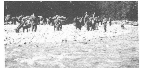
Teile des III. Bataillons nach dem Übergang über den Bsyj

lichen Mg-Kasten erkannt und nahmen mit Recht an, dass sich in der Nähe deutsche Soldaten befinden müssten, sofort gellten ihre Alarmrufe und im Umsehen war die ganze nachfolgende Feindeinheit gewarnt. Der Feuerüberfall liess sich nicht mehr durchführen, die Absicht des Zugführers war misslungen. Die Unachtsamkeit mit dem liegengebliebenen Mg-Kasten hatte ein sich rasch entwickelndes, heftiges Gefecht mit dem gewarnten Gegner zur Folge, wobei die Sowjets angriffen und den Passeingang freizukämpfen suchten. Gegen 1100 eintreffende eigene Teile kamen gerade noch rechtzeitig zur Verstärkung des hart bedrängten Spitzenzuges, den der angreifende Gegner an den Hängen beidseitig zu umklettern versuchte. Erst gegen 1400 hatte die 12. Kompanie vollzählig den Achiboch-Pass erreicht, der nun in weiterem Kampf gehalten werden konnte.