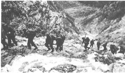
12. Kompanie im Anstieg zum Achiboch-Pass

4. Alle Tragtiere bleiben vorerst zurück (da sie bei einem zu erwartenden Gefecht nur äusserst hinderlich wären) und werden von den Tragtierführern zur Seite geführt, um den Weg für die weiteren Teile des Bataillons freizuhalten.