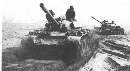
Panzer einer polnischen Einheit fahren in den Gefechtsraum.