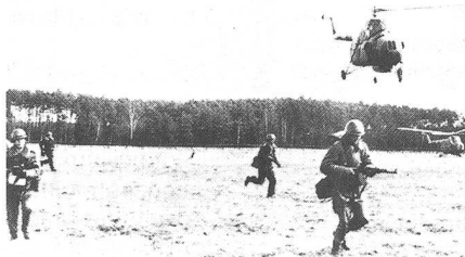
Infanterieangriff mit Helikopter-Unterstützung.