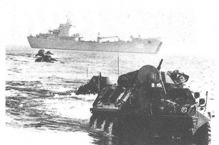
Zusammenarbeit Heer-Marine. Amphibische Panzer fahren an Land. DUKAS