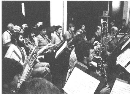
Alle waren neidisch auf die Besetzung der Sarnen Feldmusik