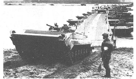
Leichte Panzerkampfwagen überqueren einen Fluss auf einer mobilen Pontonbrücke.