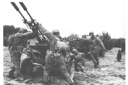
Flab der 6. Polnischen (Pommern) Luftlandedivision geht in Stellung.