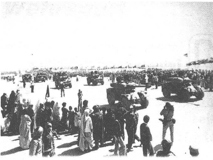
Erbeutete marokkanische Panzerfahrzeuge werden in der Polisario-Parade vorgeführt und anschliessend wieder gegen die unwillig kämpfenden Truppen König Hassans II. eingesetzt.