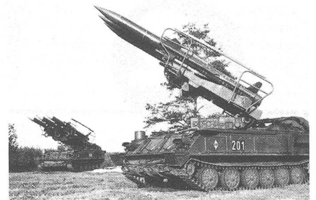
Polnische mobile Batterie Boden-Luft-Raketen.