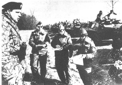
Sowjetisch-polnische Zusammenarbeit bei der Befehlsausgabe für eine Einheit gepanzerter Fahrzeuge.

Vergangenen März haben in Polen die WAPA-Manöver «Sojus 81» = «Freundschaft» stattgefunden. Neben den aus der UdSSR verstärkten, in Polen garnisonierten Sowjettruppen, haben an dieser Übung auch Streitkräfte der DDR, der CSSR und Polens teilgenommen. – Unser Bild zeigt die militärischen Big Bosse der WAPA-Armeen. Von rechts: Armeegeneral Heinz Hoffmann, Verteidigungsminister der DDR; Armeegeneral Wojciech Jaruzelski (aus altem galizischem Adel, unter der österreichischen Monarchie noch «Edler von Jaruzelski» geheissen), Ministerpräsident und Verteidigungsminister von Polen; Marschall Viktor Kulikow (UdSSR), Oberkommandierender der WAPA-Streitkräfte und Manöverleiter; General Martin Zur, tschechischer Verteidigungsminister und weitere Generale.