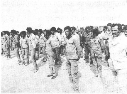
Gefangene marokkanische Soldaten werden zur Schau gestellt