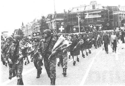
Einmarsch des Schweizer Bataillons, die Damen der Armee in die Mitte genommen, reich mit Blumen beschenkt.