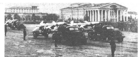
Flab-Rakete bei der Militärparade in Ulan Bator 1980.

An technischen Mitteln verfügt die Mongolische Volksarmee über 150 Panzer (vorwiegend des Typs T-54 und T-55), 12 MiG-21 Kampfflugzeuge und über insgesamt 40 Spezialflugzeuge verschiedener Art. Geschosswerfer BM-21 und Flab-Raketen gehören auch zum Arsenal der Volksarmee, die, sollte es im Fernen Osten einmal zu einem Krieg kommen, ihre Aufgabe im engen Bunde mit der Sowjetarmee erfüllen wird.