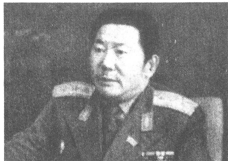
Generaloberst Sharantain Avchia, Minister für Verteidigung der Mongolischen Volksarmee.

Die Geschichte begann eigentlich im November 1920. In diesem Zeitpunkt war die Mongolei als Königreich ein Pufferstaat zwischen Russland und China. Obwohl juristisch unabhängig, stand das Land nach dem Sturz der Monarchie in Russland unter starkem chinesischen Einfluss. Nach dem Sieg Lenins und der Ausdehnung der bolschewistischen Herrschaft über den Ural fanden zahlreiche Weissgardisten in der Mongolei eine Bleibe, wo sie sich in verschiedene Gruppen organisierten. Es stand freilich nicht im Interesse der Sowjetregierung, einen gegnerischen Nukleus unmittelbar an der Grenze des angehenden sowjetischen Imperiums zu dulden. Deswegen liessen Lenins Emissäre aus einer zahlenmässig unbedeutenden Gruppe von etwa 160 mongolischen Sympathisanten am 1. März 1921 eine «Volkspartei» bilden, um sie kaum zwei Wochen später unter der Führung von Suche-Bator als «Volksregierung» auszurufen.