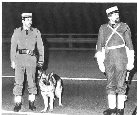
In voller Konzentration das wertvolle Team Hundeführer/Diensthund und daneben der Mann der Armeepolizei.

Für die in der letzten WK-Woche stehenden Wehrmänner der HP Kp II/1 war diese Aktion bestimmt ein krönender Abschluss ihres Wiederholungskurses und für die Kantonspolizei eine Genugtuung zu sehen, wie in Zusammenarbeit mit der Armeepolizei eine solche Grossverkehrskontrolle reibungslos und effizient abgewickelt werden kann.