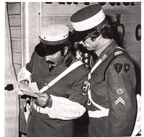
Mit kritischen Blicken wird hier ein Ausweis auf Richtigkeit und Echtheit geprüft.