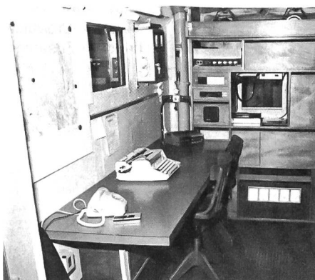
Im Einsatz stand auch diese mobile Einsatzzentrale. Der in eigener Regie um- und ausgebaute geländegängige Sanitäts-Mowag – ausgerüstet mit Notstromaggregat, Lichtmast, Funk mit Zerhacker, Tonbandgerät, Schreibmaschine, Vervielfältigungsapparat, Kartenmaterial usw – hat sich als KP-Front bereits in mehreren Einsätzen bestens bewährt.