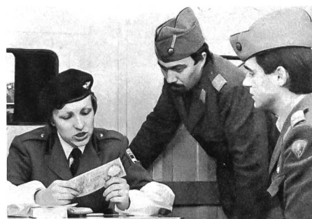
Nicht nur die Polizeibeamtin, auch die Offiziere der Armee interessiert die Echtheit dieser Banknote.