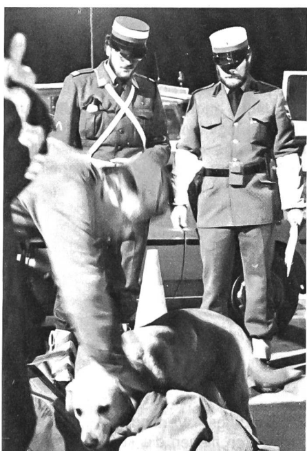
Aufmerksam wird die Arbeit des Haschhundes verfolgt, der in diesem Fall zum Erfolg und zur Verhaftung von drei Betäubungsmittel-Delinquenten führte.