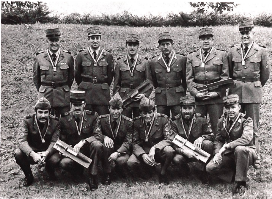
Das sind je die drei Erstplatzierten der vier Alterskategorien des Instruktor-Sommermehrkampfes 1982.