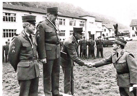
Händedruck des Ausbildungschefs für die Rangersten jeder Alterskategorie.