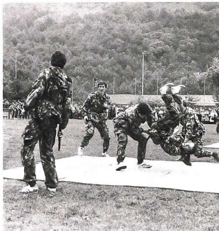
Die Soldaten der Grenadier-Rekrutenschule in Isonne TI haben am 25. September 1982 im Rahmen des Tages der offenen Tür gezeigt, was sie schon können. Unser Bild entstand bei der Nahkampf-Demonstration.