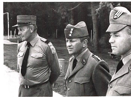
Aufmerksame Beobachter während des 100-m-Schwimmens im Bruggener Schwimmbad: Korpskommandant Roger Mabillard (Ausbildungschef der Armee), Oberst Hans Hartmann (Chef der Sektion Ausserdienstliche Tätigkeit im Stab der Gruppe für Ausbildung) und Adj Uof Viktor Bulgheroni (Zentralpräsident des Schweizerischen Unteroffiziersverbandes und Disziplinchef beim Schwimmen).

Um es vorwegzunehmen: Die Beteiligung an diesem kameradschaftlich fairen Kräfteressen, das den Instruktoren Gelegenheit bieten soll, auf freiwilliger Basis Zeugnis ihrer körperlichen Fitness abzulegen, war mehr als nur mager. Gingen nämlich an der ersten Austragung dieses Sommermehrkampfes noch 159 Ausbilder an den Start, so fanden dieses Jahr nur gerade ihrer 76 den Weg nach Brugg, um sich im 25-Meter-Pistolenschiessen (auf Olympiascheiben), beim 4000-m-Geländelauf sowie im Schwimmen (100 m, in freiem Stil) respektive beim Hindernislauf (300 m, 12 Hindernisse) zu messen. Die erreichten Dreikampfergebnisse dokumentieren, dass die Idee nicht unangebracht ist, das Instruktionspersonal unserer Armee künftig zur Teilnahme an diesem sportlichen Kräfteressen dienstlich zu delegieren, denn bei einem militärischen Ausbilder soll nebst geistiger auch eine gewisse körperliche Fitness vorausgesetzt werden