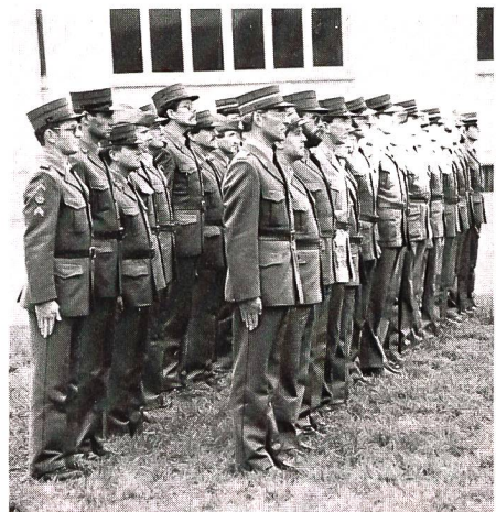
Angetreten zum Rangverlesen.