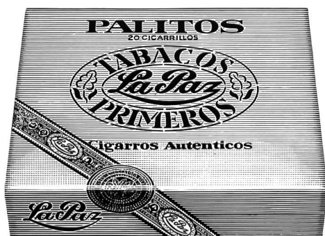
Cigarillos Palitos von La Paz Einfach und gut. Gehaltvolle Cigarillos für jede Tageszeit. Viel Aroma für wenig Geld. 20 Stück nur Fr. 5.—