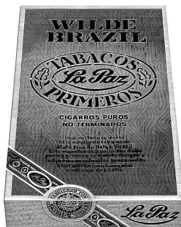
Wilde Havana und Wilde Brazil von La Paz Die oft kopierte, doch nie erreichte Wilde. Einzigartig im Aroma. Aus Tabak, mehr nicht. 5 Stück Fr. 3.—