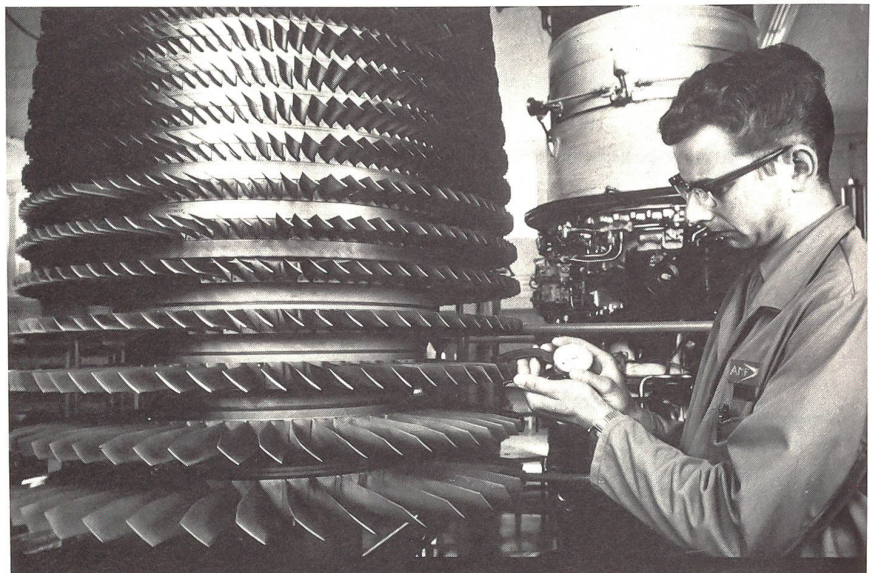
Kontrollarbeiten an Turbinenschaukeln eines Hunter-Triebwerkes.

Weil beim BAMF viel komplexes Material im Einsatz steht, sind die Anforderungen an die Mitarbeiter aller Stufen hoch. Besonderer Wert wird auf eine sorgfältige Führung gelegt mit dem Ziel, aus den gegebenen Mitteln ein Maximum herauszuholen. Die Mitarbeiter des BAMF sind überzeugt, mit diesem Vorgehen in der Lage zu sein, die Zukunft zu bewältigen. ■