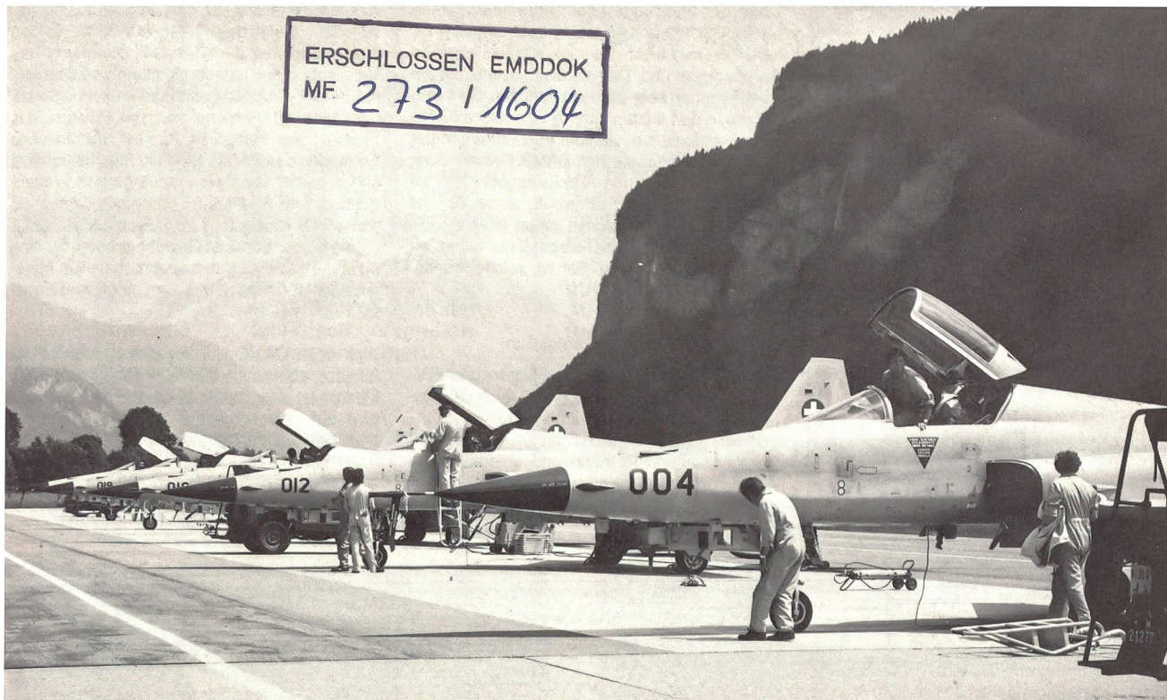
BAMF Mitarbeiter bei der Vorbereitung von F-5E Tiger II für den Flugbetrieb.