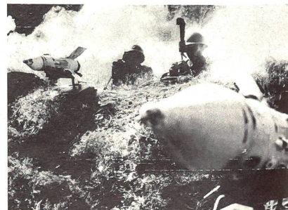
Manöver in einer Armeebasis in Peking mit Panzerabwehrraketen.