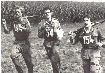
Mit vollem Einsatz dem Ziel entgegen

Die freiwilligen Wettkämpfer der Sommermeisterschaften erfreuen sich in der Felddivision 5 und in der Grenzbrigade 5 vermehrter Beliebtheit: Gegenüber dem Vorjahr steigerte sich die Zahl der startenden Wehrmänner erheblich. Waren es 1983 noch gut 1000 Soldaten, Unteroffiziere und Offiziere, die ihre körperliche Leistungsfähigkeit unter Beweis stellten, so traten in Muri über 1200 Wehrmänner zu den Meisterschaften an.