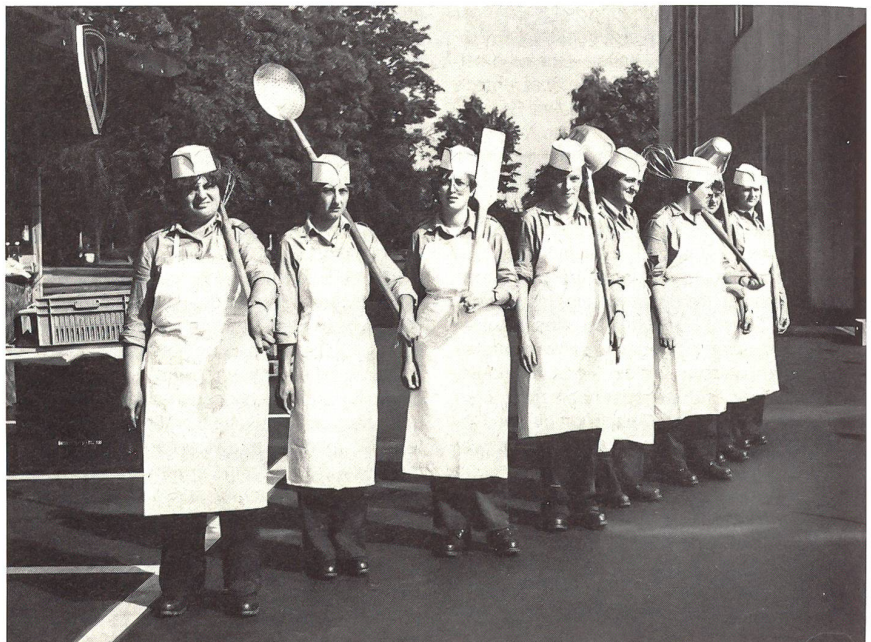
Im Militär wird mit der grossen Kelle angerichtet!

Dem Truppendienst einer Koch FHD geht ein vierwöchiger FHD Einführungskurs voraus. Bei Eignung kann sie später in einem 20 Tage