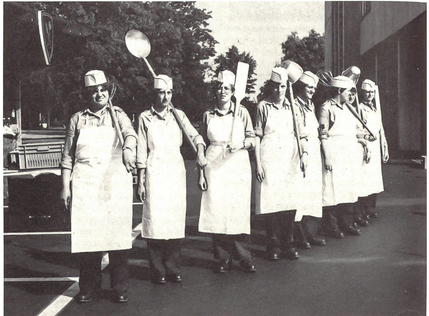
Im Militär wird mit der grossen Kelle angerichtet!

Dem Truppendienst einer Koch FHD geht ein vierwöchiger FHD Einführungskurs voraus. Bei Eignung kann sie später in einem 20 Tage