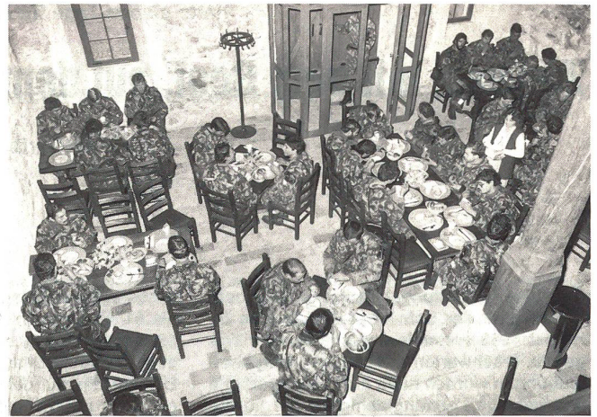
Nur ein einziges Mal gab es während der siebentägigen Durchhalteübung einen so feudalen Rastort wie hier beim Frühstück in der Schenke beim Schloss Mörsburg (bei Seuzach).

brücke von Camions – kreuz und quer durch «Mostindien» nach Tägerwilen am Bodensee ging, wobei unterwegs natürlich beim Lösen verschiedener Aufgaben nebst körperlicher Kondition auch immer wieder «Köpfchen» für die Zielfindung nötig waren. Doch das grosse, kräftezehrende Finale stand erst noch bevor: Am Dienstagabend ab 22 Uhr starteten die