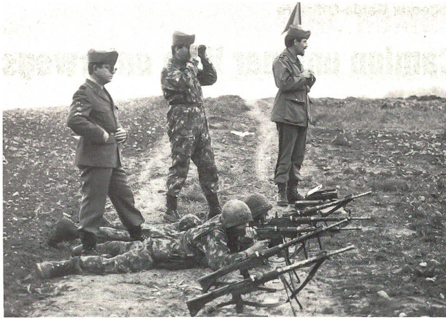
Sturmgeschweherschiesen nach 75 Marschkilometern, wenn der Krampf die Beinmuskeln «traktiert» und die Füsse «brennen»: keine leichte Sache!