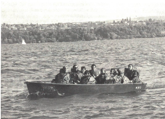
Genie-Offiziersschüler auf «fremden Gewässern», genauer gesagt auf dem Bielersee.