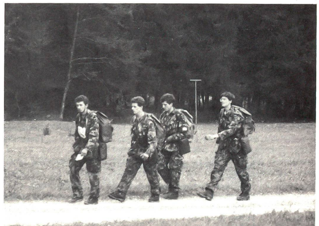
Auf dem 100-km-Marsch: Strasse ohne Ende...