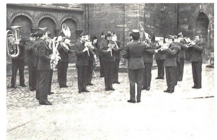
Vor und im Münster begleitete das Militärspiel Basel-Stadt die Beförderungsfeier.

Für jede Vorlesung muss ein Kursgeld von Fr 8.- (für das ganze Semester) auf dem Rektorat der ETH Zürich, bzw auf der Kanzlei der Universität Zürich entrichtet werden.