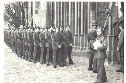
Die Unteroffizierschüler – schon im Schmucke des eben erworbenen Gradabzeichens – vor dem Einmarsch ins Münster.