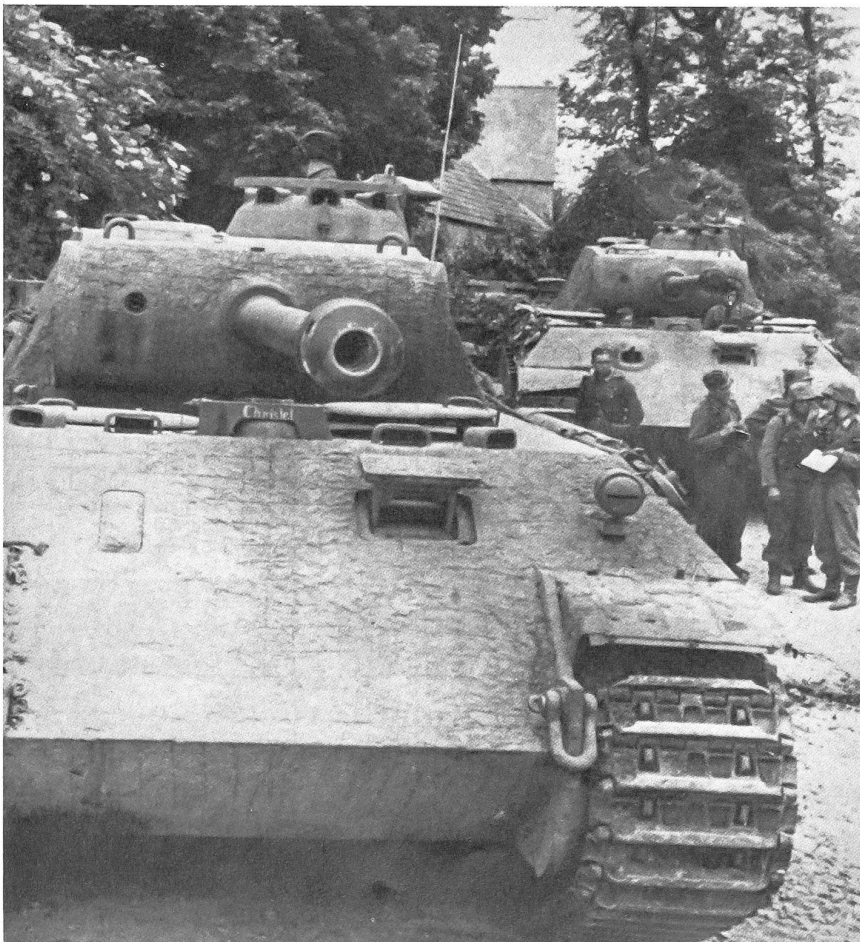
Deutsche Panzer Typ «Panther» in der Bereitstellung; stark abgegrängte Fahrerfront