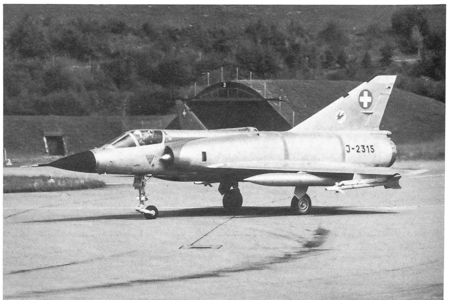
Mirage IIIS der Staffel 17 des UeG. Das UeG setzt zwei Staffeln Mirage IIIS für Abfangjagdaufgaben ein.