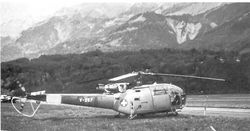
Alouette III Mehrzweckhubschrauber. Das UeG setzt diesen Typ beim Militärhubschrauberrettungsdienst ein.

Die Schweizer Armee beruht auf dem Prinzip des Milizsystems, das heisst, dass keine Berufseinheiten zur Sicherung unseres Landes bestehen. Eine Ausnahme dazu bildet das Überwachungsgeschwader (UeG), das als Teil der Flugwaffe der einzige Berufsverband unserer Armee ist.