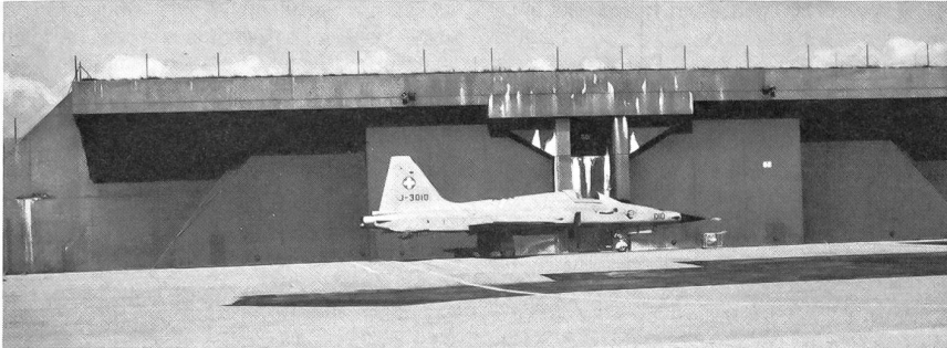
F-5E Tiger II der Staffel 18 vor einem Unterstand. Sämtliche Flugzeuge des UeG sind vor Feindeinwirkungen wirkungsvoll in Felskavernen oder in NEMP-gehärteten Unterständen geschützt.