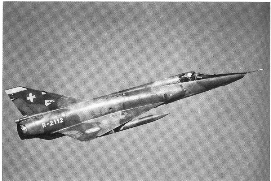
Mirage III RS Aufklärer der Staffel 10.