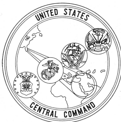
Das Emblem des neuen «US Central Command». Es zeigt in vier kleinen Kreisen die Wappen der vier US-Teilstreitkräfte sowie die strahlenförmige Machtprojektion aus den USA in den «südwest-asiatischen» Raum.

Während früher die Grenze zwischen dem Verantwortungsbereich des Pazifikkommandos und des Europakommandos die Region des Mittleren Ostens und des Persischen Golfes präzise entzweischneidete, ist dem «CENTCOM» nun ein selbständiger geographischer Raum als Verantwortungsbereich zugeordnet worden, der die erwähnte Region als Gesamtes unter ein einheitliches und einzig verantwortliches Kommando bringt. Dazu gehören grob umschrieben etwa Nordostafrika (von Ägypten bis