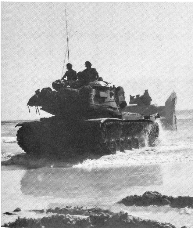
Kampfpanzer des Typs M-60 des US-Marinekorps fahren aus Landungsbooten (des amphibischen Helikopterträgers «Saipan») an Land.