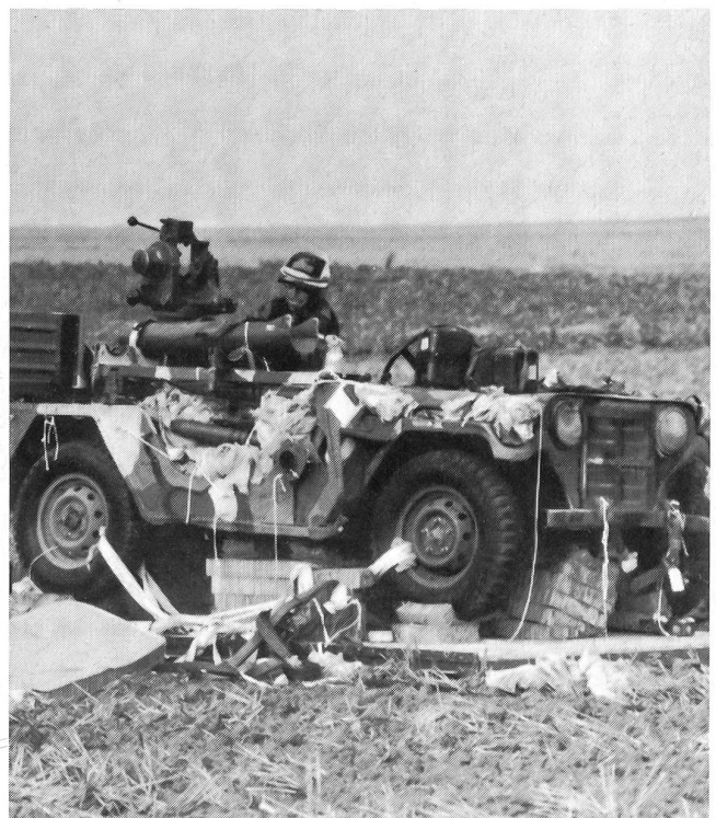
Zur Bewaffnung der 82. Luftlandedivision gehören auch auf Jeeps montierte Panzerabwehrk Waffen des Typs «Tow». Hier entledigen Fallschirmjäger einen per Fallschirm abgeworfenen «Tow»-Jeep von seinen Polstern anlässlich einer Übung in der Bundesrepublik Deutschland 1982.