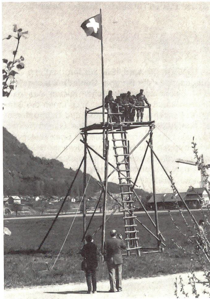
Gute, traditionelle Geniestarbeit.