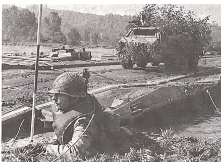
Gefechtsfahrzeuge (Pz Aufklärer Fuchs) der Bundeswehr überqueren den Main nach einem Brückenschlag. HSD