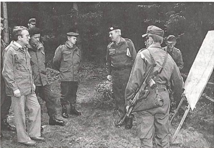
Der Gast aus der Schweiz bei einer Jagdkampfbübung der Theresianischen Militärakademie im Gebiet des Hochwechsels.

Auf Einladung von Verteidigungsminister Dr Robert Lichal hielt sich sein Schweizer Amtskollege, Bundesrat Prof Dr Arnold Koller, anfangs Juni für drei Tage zu einem offiziellen Besuch in Österreich auf. In Arbeitsgesprächen mit Minister Dr Lichal liess sich der Gast über Fragen der Umfassenden Landesverteidigung, des Raumverteidigungskonzeptes und der Offiziersausbildung im österreichischen Bundesheer informieren. Er besuchte auch die Landesverteidigungsakademie in Wien sowie die Theresianische Militärakademie in Wiener Neustadt und nahm an einer Jagdkampfbübung der Offiziersschüler im Raum Hochwechsel teil. Nach Gesprächen mit Wirtschaftsminister Robert Graf wurde Dr Koller auch von Vizekanzler Aussenminister Dr Alois Mock empfangen. J - n