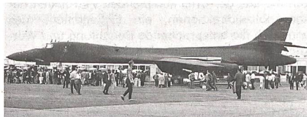
37. Internationaler Luftfahrtsalon Le Bourget (1.–21.6.1987)

Zu den Attraktionen der Luftfahrtschau gehörte ein amerikanischer Langstreckenbomber des Typs B-1B, des modernsten Exemplars der strategischen Bomberflotte der US.