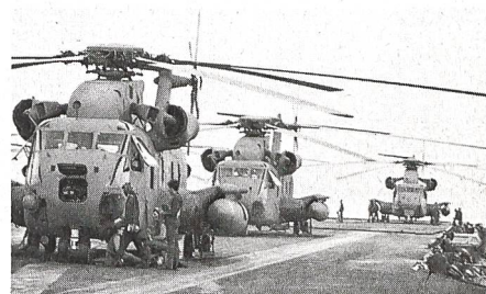
1. SEA STALLION

Unterstützt werden helikoptertransportierte Truppenteile nach Möglichkeit von eigener Artillerie, Erdkampf- und Jagdflugzeugen sowie Kampftransporthubschraubern. Verschiedene Transporthelikopter können für die oben erwähnten Aufgaben mit Maschinenwaffen und/oder un gelenkten Luft-Boden-Raketen bestückt werden.