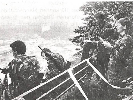
Hoch über dem Aaretal befand sich der Posten «Distanzenschätzen».

Um Friktionen zu vermeiden, wurde rechtzeitig mit den Gemeindebehörden, dem Kreisforstamt und den Jagdgesellschaften Kontakt aufgenommen, und so sah man denn unterwegs zu den Posten nicht nur Zweier-Patrouillen mit geschulterten Gewehren, sondern auch (unbewaffnete) Jäger, die darüber wachten, dass die Tierwelt des Waldes nicht übermässig gestört wurde. Der Boden war, obwohl mittlerweile der Sommer mit voller Kraft Einzug gehalten hatte, von den vorangegangenen Regenfällen noch schwer, und die Posten waren so gelegt, dass die Versuchung, Wege zu verlassen und Abkürzungen durch den Wald zu wählen, klein war.