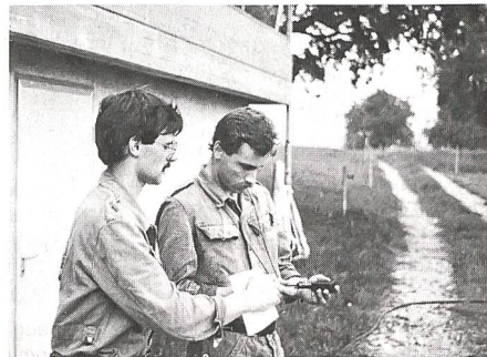
An der Felddienstübung des UOV Gossau wurde die Postenarbeit...