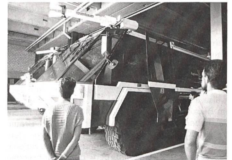
40 Tonnen schwere Tanklöschfahrzeuge können auf dem Flughafen Kloten im Ernstfall eingesetzt werden.

Mit einer Besichtigung der Feuerwehr auf dem Flughafen Kloten wurde die erste Hälfte des Jahresprogrammes des UOV Untersee-Rhein abgeschlossen. Wie Wm Iwan Bolis schreibt, wurden den ausserdienstlich engagierten Unteroffizieren und Angehör-