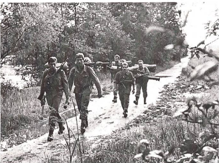
... die Übersicht zu behalten, sich durchzusetzen und seine Gruppe zu führen.