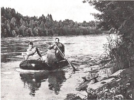
Die Kaderübung «Jagdkampf im Jura» zeigte, dass nur ein gut trainierter Unteroffizier in der Lage ist, in physischen Stresssituationen ...

mern des Vereines besucht und hatte zum Ziel, die Unteroffiziere im Führen unter physischer Belastung zu schulen sowie in den Elementen des Jagdkampfes weiterzubilden.