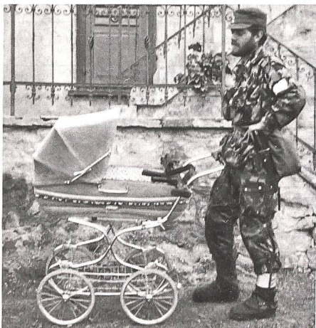
Einrücken mit Kind und ...! Soweit kommt es nicht, wenn sie frühzeitig vor dem Dienst handeln.

Wenn alle Ihre eigenen Bemühungen erfolglos bleiben, können Sie sich zudem vertrauensvoll an die