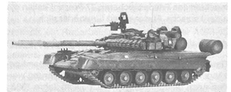
Bild: Die Seitenansicht eines T-80 verdeutlicht die Anbringung der Zusatzpanzerungs-Segmente. Hierbei handelt es sich um ein Modell, das nicht die korrekte Laufwerksanordnung mit den unregelmässigen Abständen zeigt. Auch fehlen die im vorderen Teil der Kettenblenden angebrachten Zusatzpanzerungsteile. Die Befestigungsbolzen sind zu sehen.

Bei 40 Prozent der sowjetischen Truppenteile in der DDR sowie in mehreren Verbänden in der westlichen UdSSR ist der Panzer T-80 eingeführt. Der T-80 weist gegenüber dem vom Entwicklungsstand her ca 15 Jahre älteren T-64 wenig Verbesserungen auf. Hervorzuheben ist eine deutliche Steigerung der Beweglichkeit, allerdings auf Kosten eines ca doppelt so hohen Treibstoffbedarfs für die Turbine.