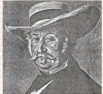
General John A Sutter, nach einem Gemälde des berühmten Schweizer Malers Frank Buchser. Das Bild ist im Kunstmuseum Solothurn.