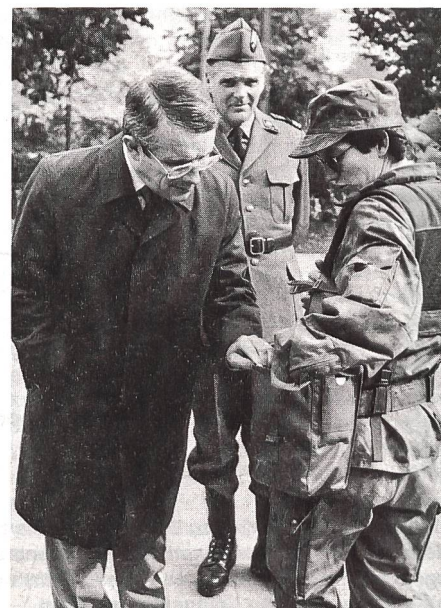
Anlässlich seines Besuches der MFD OS 1987 liess sich Bundesrat Koller auch Teile der neuen Ausrüstung genauer vorführen.

Ebenfalls abgegeben wird ein Kurzarmleibchen (T-Shirt) zum Tarnanzug.