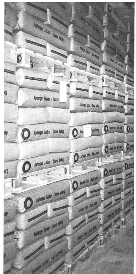
Zucker-Pflichtlager im Armeeverpflegungsmagazin (AVM) Brenzikofen

Ein von einer welschen Klasse der Küchenchefschule Thun vorzüglich hergerichtete Mittagssmahl und die anschliessende interessante Besichtigung des Armeeverpflegungsmagazins (AVM) in Brenzikofen, unter Leitung von Oberst Fabio Pfaffhauser , haben dies verdeutlicht.