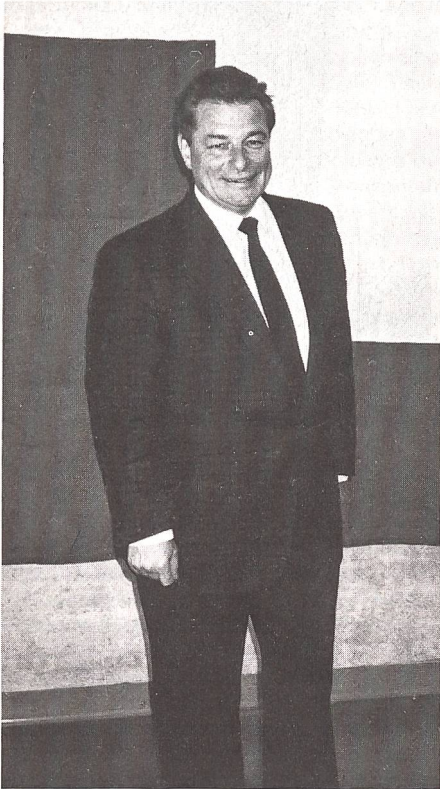
Gastgeber Bundesrat Jean-Pascal Delamuraz, Vorsteher des Eidgenössischen Volkswirtschaftsdepartementes

Heute, nach seinem Wechsel vom Militärdepartement ins Volkswirtschaftsdepartement steht Bundesrat Jean-Pascal Delamuraz der Landwirtschaft noch näher als Ende 1986, wo er, begleitet von einigen seiner engsten Mitarbeiter, auf dem Waffenplatz Thun 50 Agrarjournalisten zu einem Gespräch eingeladen hat. Der Gastgeber sagte es aber schon zu diesem Zeitpunkt klar und deutlich: «Die Landwirtschaft, die ihr Land zur Benützung militärischer Übungen zur Verfügung stellt und die durch ihre Nahrungsmittelproduktion zur Unabhängigkeit der Schweiz beiträgt, spielt in der Landesverteidigung eine entscheidende Rolle.»