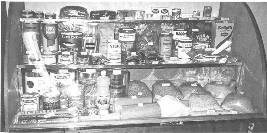
Das Armeeverpflegungsmagazin (AVM) in Brenzikofen hat der Truppe 61 Artikel anzubieten