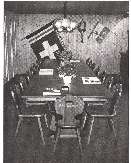
Das Vereinslokal des UOV Emmenbrücke mit den neuen Tischen und Stabellen.

Das Vereinslokal wurde mit zwei Tischen verschönert. Einzelne Mitglieder konnten die zugehörigen Stabellen kaufen und ihre Namen einschnitzen lassen.